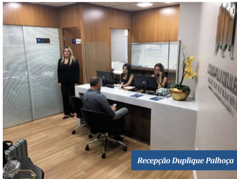
Recepção Duplique Palhoça

Possuindo uma carteira de clientes, composta por mais de 600 (seiscentos) condomínios