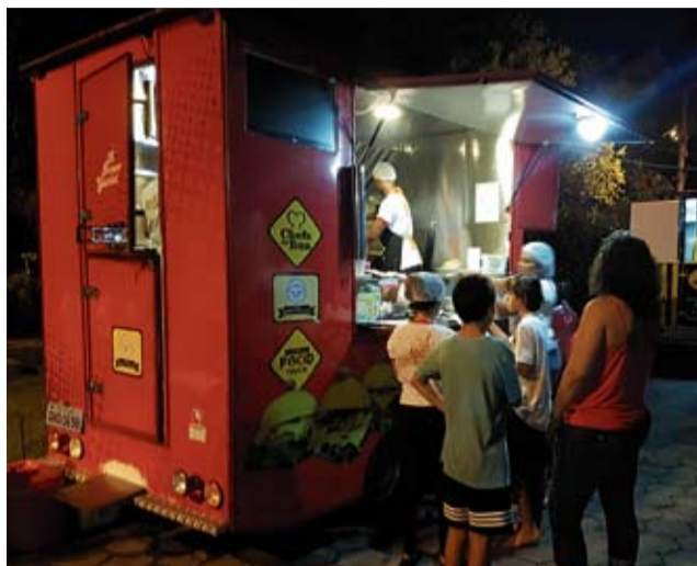
O Food Truck no Condomínio Central Park já está na quinta edição

Até agora já foram feitas experiências com hambúrguer, crepe e espetinho de carne. Na próxima