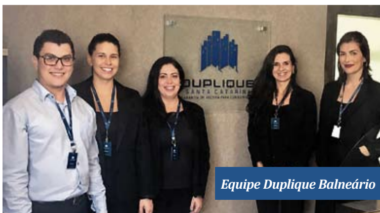
Equipe Duplique Balneário

DUPLIQUE SANTA CATARINA , não apenas a maior, simplesmente, a MELHOR GARANTIDORA DE RECEITA DO ESTADO .