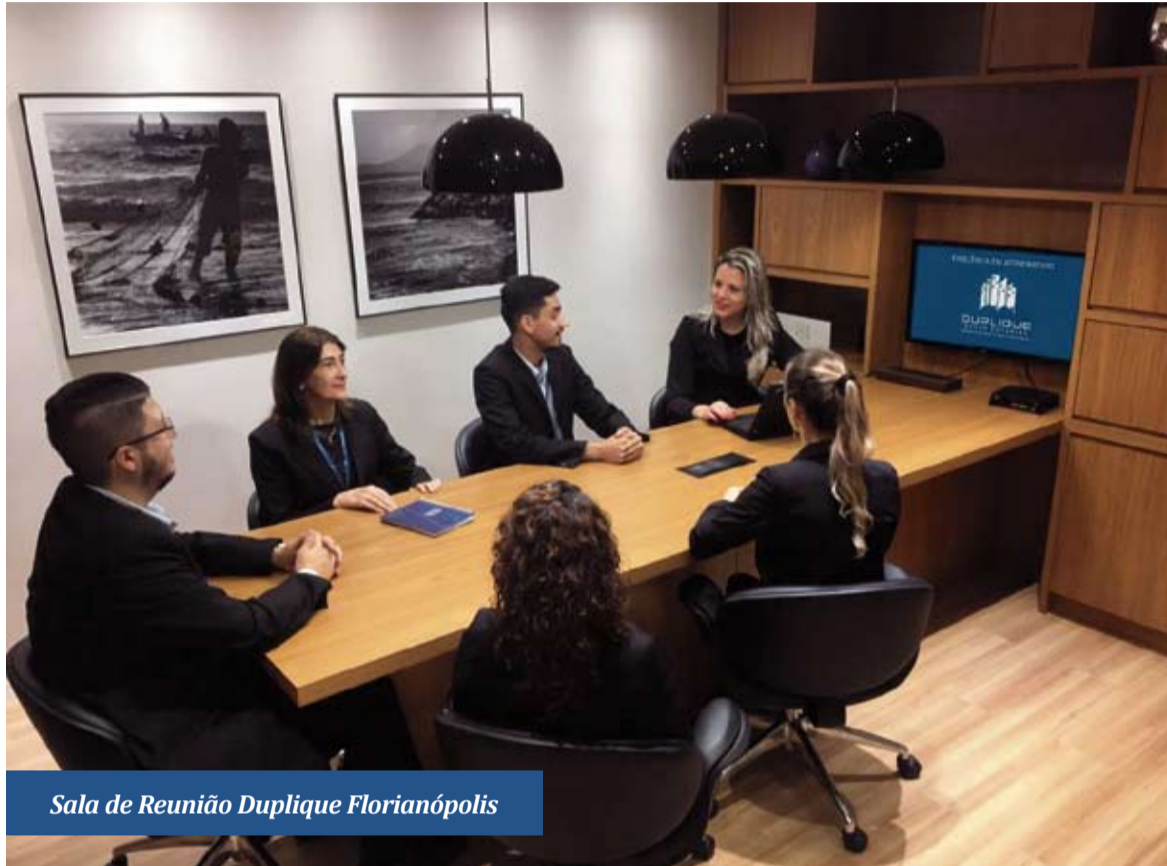
Sala de Reunião Duplique Florianópolis

Fundada em 1994, e atuando no segmento de cobrança e garantia de receita para condomínios, a DUPLIQUE SANTA CATARINA vem possibilitando aos seus clientes, gerirem de forma tranquila as obrigações assumidas frente a fornecedores e fun-