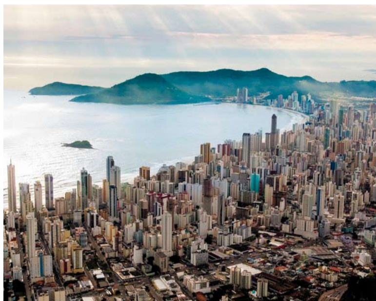
Em Balneário Camboriú, os imóveis que contam com sistemas de segurança são mais valorizados